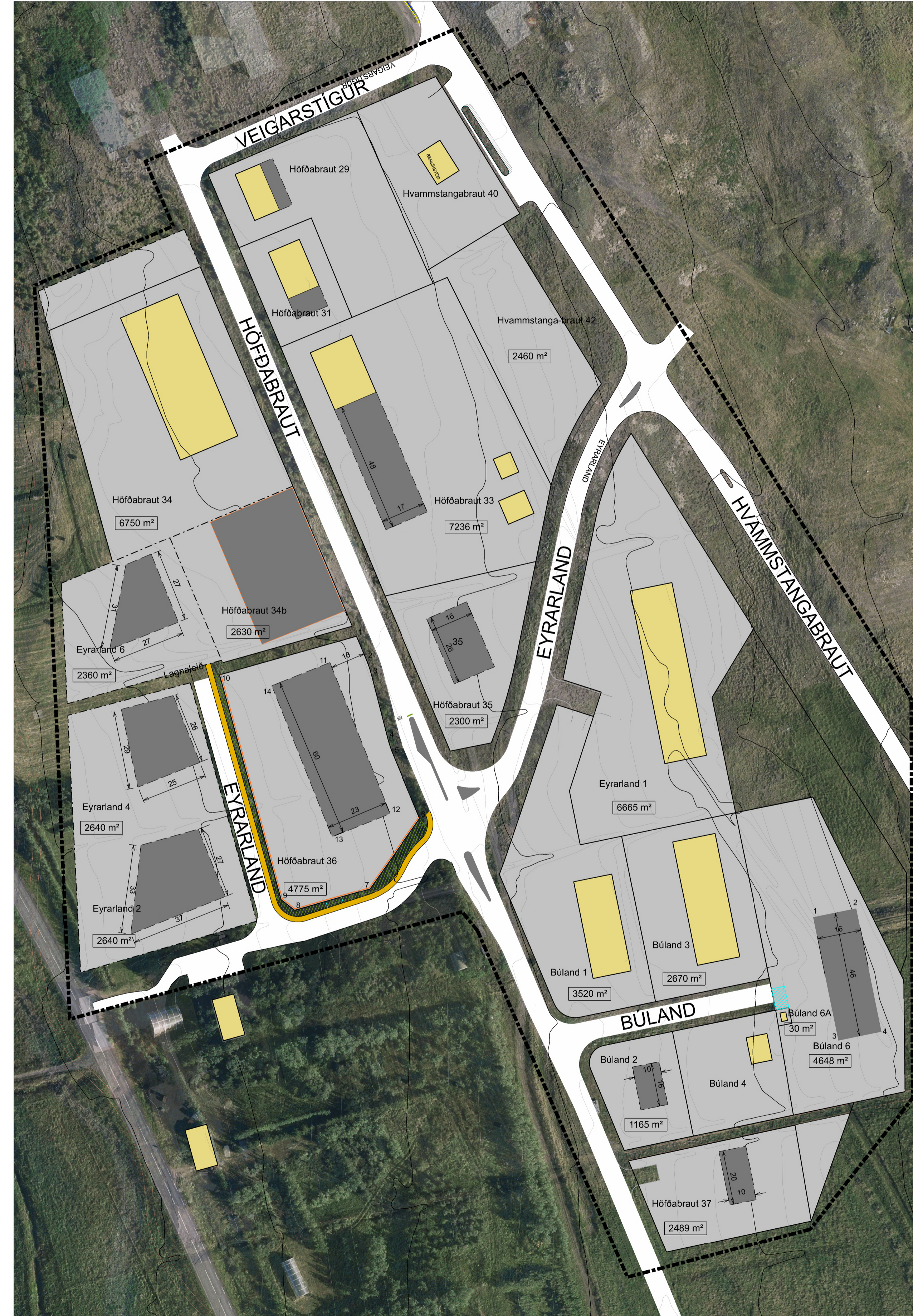
Tillaga að breytingu á deiliskipulagi í júní 2024.